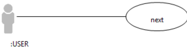
Diagramme de communication ( communication diagram ) du cas d'utilisation « next » :

Diagramme des cas d'utilisation ( use case diagram ) :