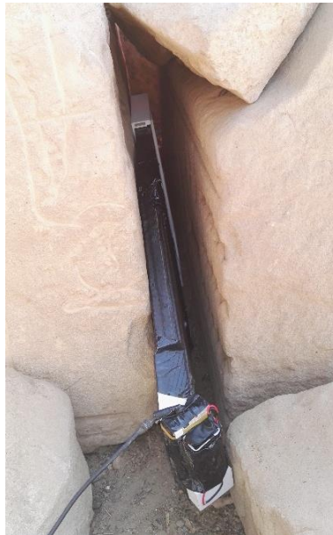
Figure 2: Cas concret d'utilisation du wedge pour imager des zones difficiles d'accès

Finalement, il est nécessaire de comparer les résultats des différentes techniques d'acquisition, soit par rapport à un objet dont la géométrie est connue, soit par rapport à des techniques d'acquisition sans contraintes.