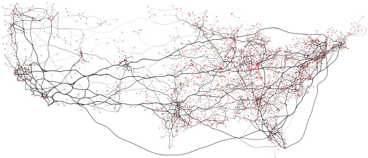
Figure : Vue synthétique des migrations étatsuniennes.

L'utilisation de cette discrétisation donne beaucoup souplesse sur l'application la méthode de routage et permet ainsi de produire de nombreuses visualisation en fonction du niveaux de réduction de bruit désiré. La figure ci-dessous montre le résultat de notre méthode sur le réseau de la figure 1.