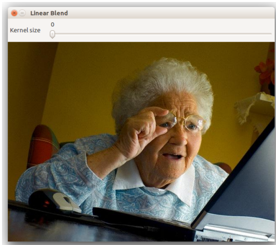
(a) Kernel_size = 0