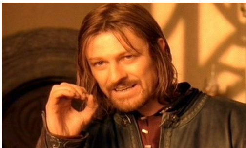
(a) Input image