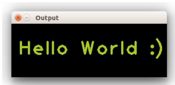
Figure 1: Résultat final attendu.

Écrire "Hello World :)" en vert au milieu de la fenêtre.