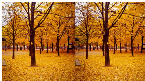
Figure 3: Exemple d'image stéréo à découper.