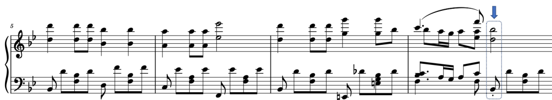
FIGURE 1 – Une cadence parfaite authentique (PAC) marquant la fin d'une phrase dans l' Impromptu No.3 de F. Schubert.