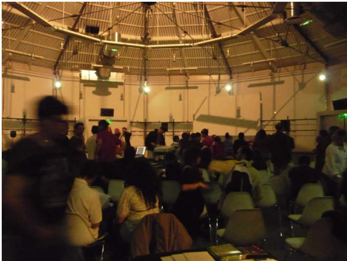
FIGURE 2.11 – le Marché de Lerne.

Le SCRIME affirme à nouveau sa volonté de mettre en avant un style de création sur support bien particulier : les vidéo-musiques, par ce concert de début d'année, parfois dédié aux jeunes compositeurs par le passé.