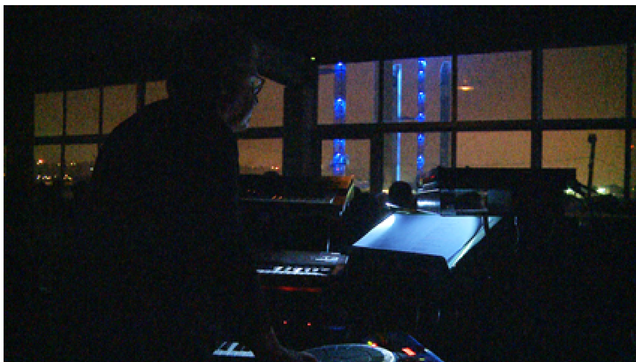
FIGURE 2.10 – György Kurtág.

”Fluxus” raconte l’histoire métaphorique d’un fleuve depuis sa source jusqu’à la mer. Les spectateurs installés dans la pénombre face à la Garonne, sont immergés dans un univers onirique mêlant la voix des acteurs aux machines sonores du compositeur György Kurtág. Une invitation à naviguer entre fiction poétique et présence évocatrice du fleuve.