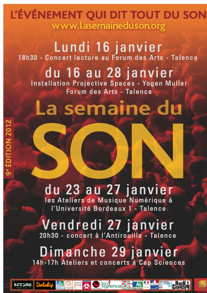
FIGURE 2.7 – la semaine du son.

La Semaine du Son 2012 a encore compté le SCRIME et l'association Dolabip parmi ses participants actifs avec les ateliers de musique numérique de Talence qui se sont déroulés du 23 au 27 janvier au sein de l'Université Bordeaux 1.