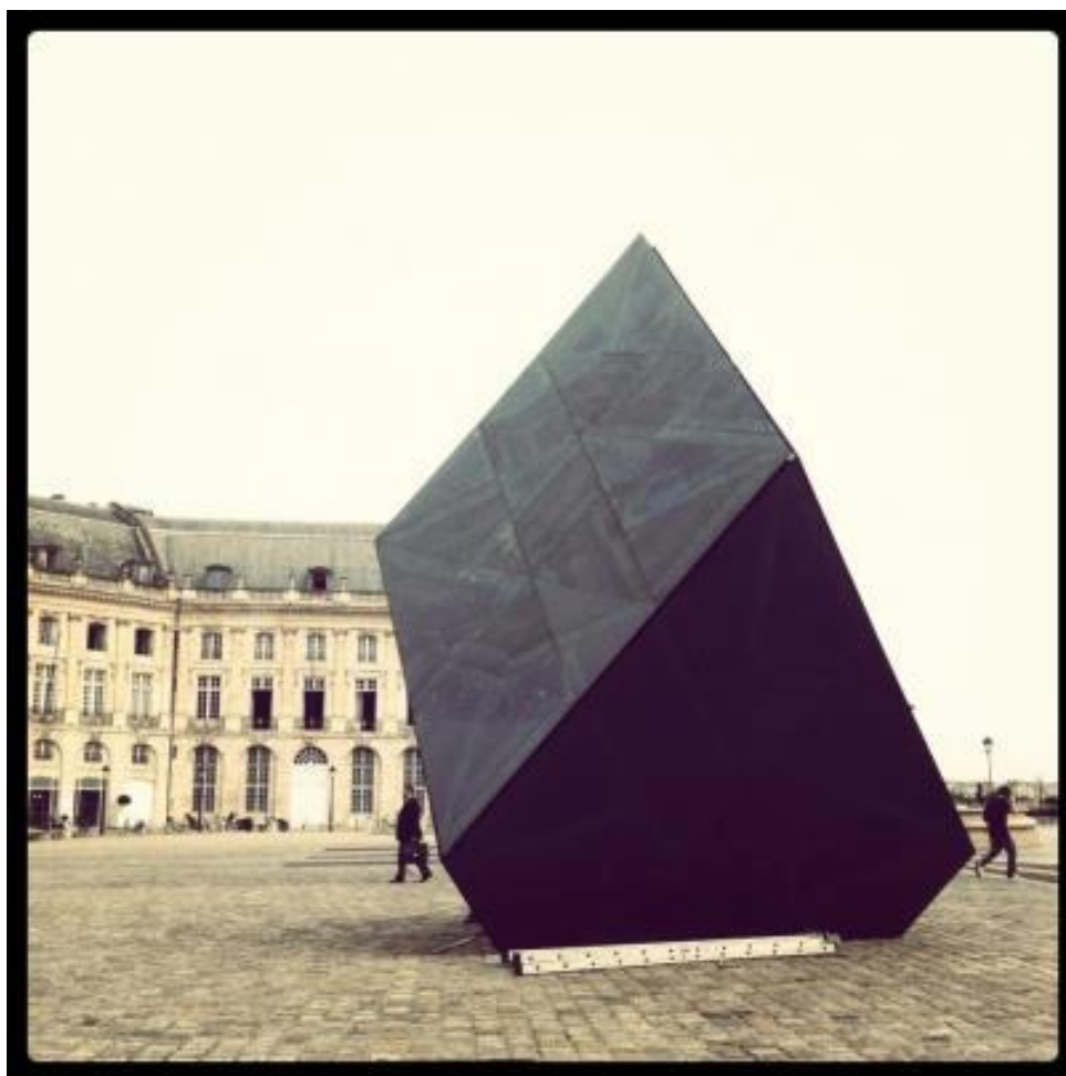
FIGURE 2.5 – la pièce d'architecture rhomboédrique, Place de la Bourse, Bordeaux.