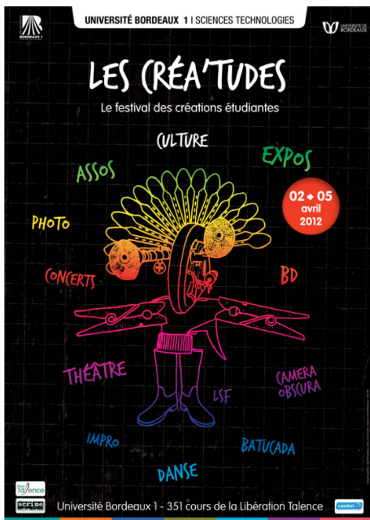
FIGURE 2.12 – affiche des Créa'tudes édition 2012.