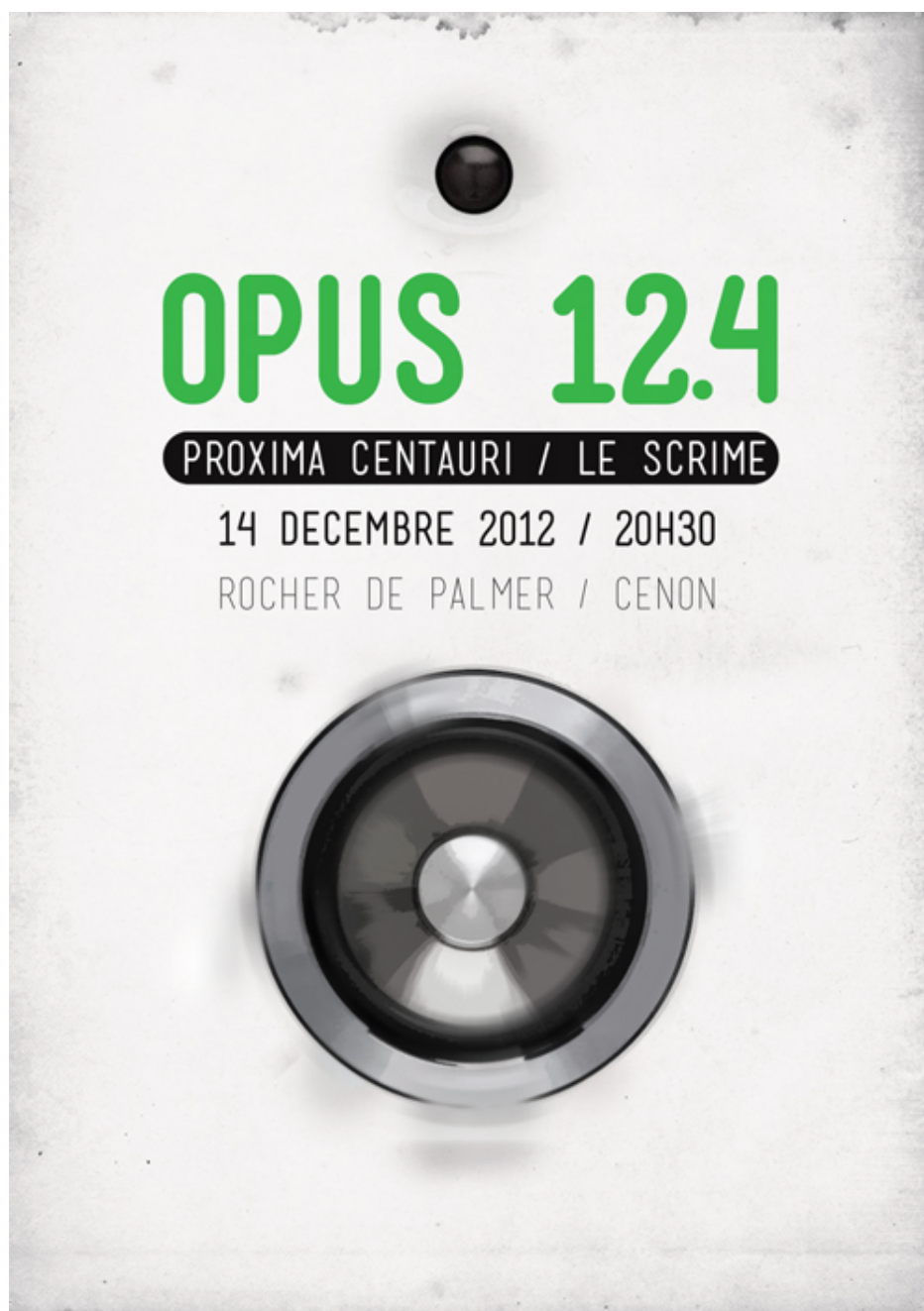
FIGURE 2.16 – flyer de l'Opus 12.4 au Rocher de Palmer.

Proxima Centauri invite le SCRIME pour une soirée électrisée associant instruments acoustiques et dispositifs électroniques, mis en espace et projetés sur un orchestre de haut-parleurs. A cette occasion est rendu un hommage à Horacio Vaggione, compositeur d'origine argentine dont l'œuvre singulière se situe au cœur du développement de la musique avec ordinateur.