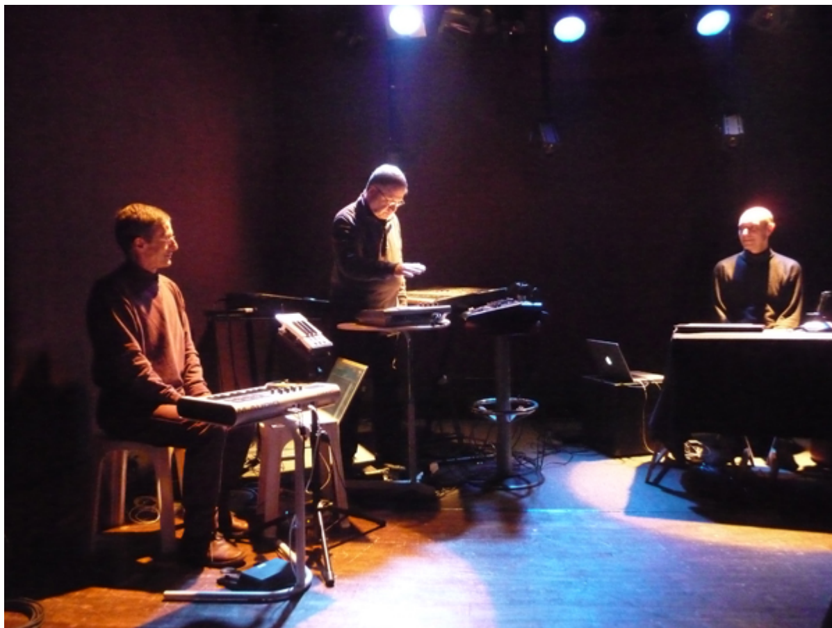
FIGURE 2.8 – les Complémentaires en concert à l'Antirouille.

La journée du 27 s'est clôturée par un concert des Complémentaires à l'Antirouille (Rock & Chanson, Talence).