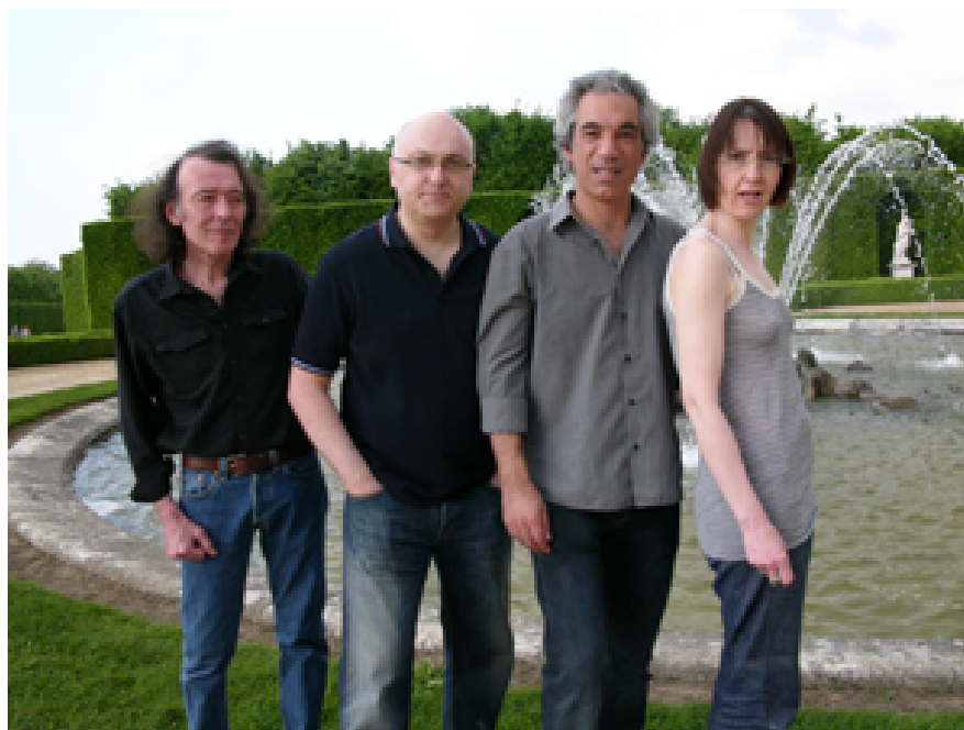
FIGURE 2.13 – les Phonogénistes.

2ème partie : Les Vertiges de l'Image, un concert live audiovisuel électronique des Phonogénistes avec Antonio Sousas Dias.