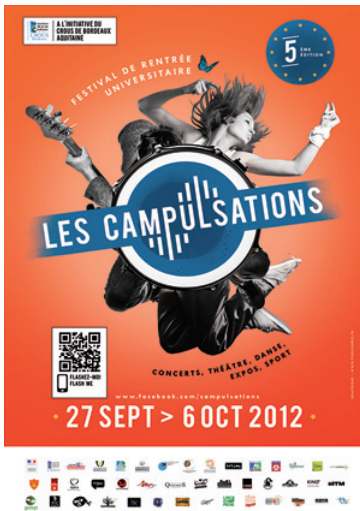
FIGURE 2.15 – affiche des Campulsations 2012.