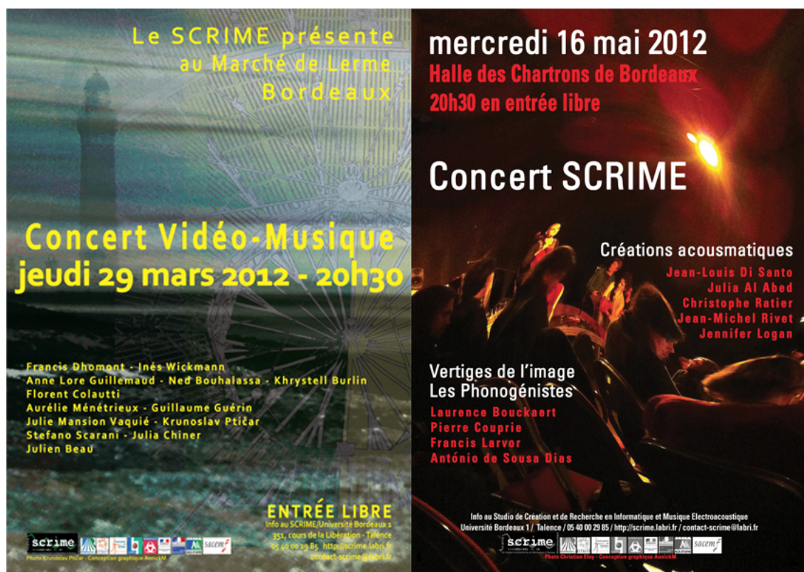
FIGURE 2.1 – les affiches des concerts des créations du SCRIME.

Enfin, plusieurs compositeurs du SCRIME (Julien Beau, Christophe Ratier, Julia Hanadi Al-Abed) ont également occupé les studios du SCRIME lors de résidences de création.